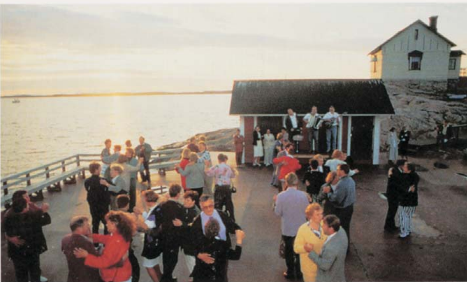
Risteilyn päätteeksi savukalailallisen jälkeen Loistokari-saarella tanssitaan laiturilla elävän orkesterin tahdittamana.

Kokonaisuuteen kuuluu yli 50 erilaista vanhaa ja uudistettua rakennusta: majoitus- ja kokoustiloja, savusaunoja, laavuja, nuotiosuojia, kaislakammioita, lintutorni.